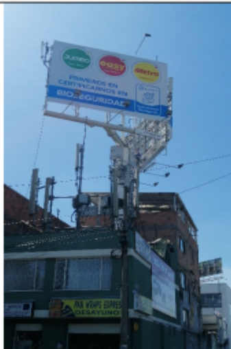
Foto No.1: Vista panorámica del predio, del panel y de la estructura de la valla, en buenas condiciones y estable, ubicada en la Calle 172 A No. 22 A 91 (dirección catastral) orientación Norte-Sur.